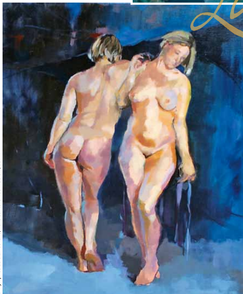
◆ Nymphes au clair de lune, huile sur toile 100 x 80 cm, 2011.