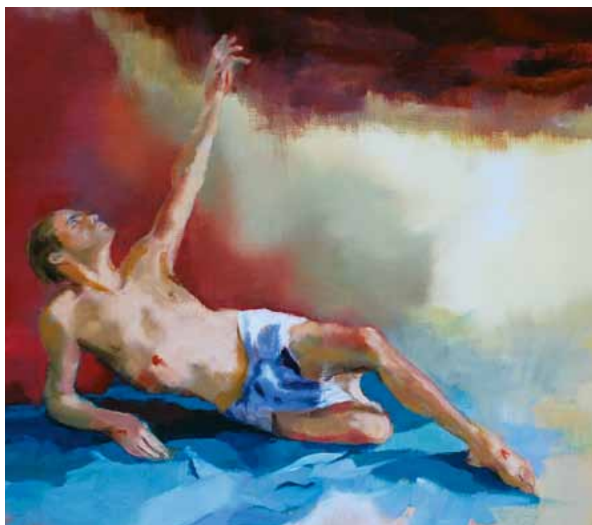
◆ Résurrection, huile sur toile 116 x 73 cm, 2011.

Béatrice Roche-Gardies : Oui, je suis parfois surprise des réactions que mes tableaux de nu provoquent. La représentation du corps et de la nudité touche les personnes et peut encore choquer. Alors quand ce ne sont pas des croquis rapides, ou bien je les couvre un peu, ou bien je leur donne une raison d'être nus. La mythologie et les récits bibliques nous donnent d'infinis prétextes. En cela je ne fais que suivre la tradition des peintres classiques. Ce n'est pas toujours facile d'inscrire le nu dans un contexte contemporain, on accepte un décor d'atelier autour du nu, mais un décor quotidien a quelque chose d'incongru. Un tableau de nu peut être interprété de mille façons.... La ligne de crête est étroite !