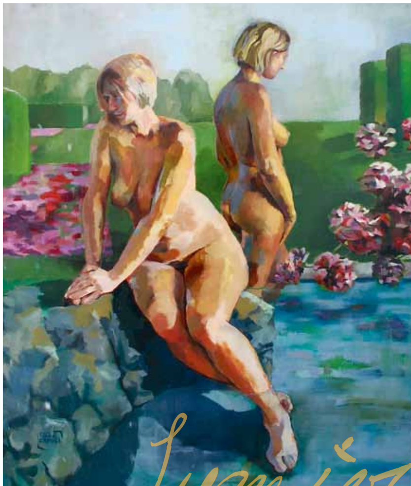
« Les Hespérides », huile sur toile 100 x 120cm, 2010, prix J.P. Brenot au salon Sainte Maure de Touraine 2010.

Et là encore, sa curiosité, son appétit de progresser la poussent à aborder des thématiques aussi