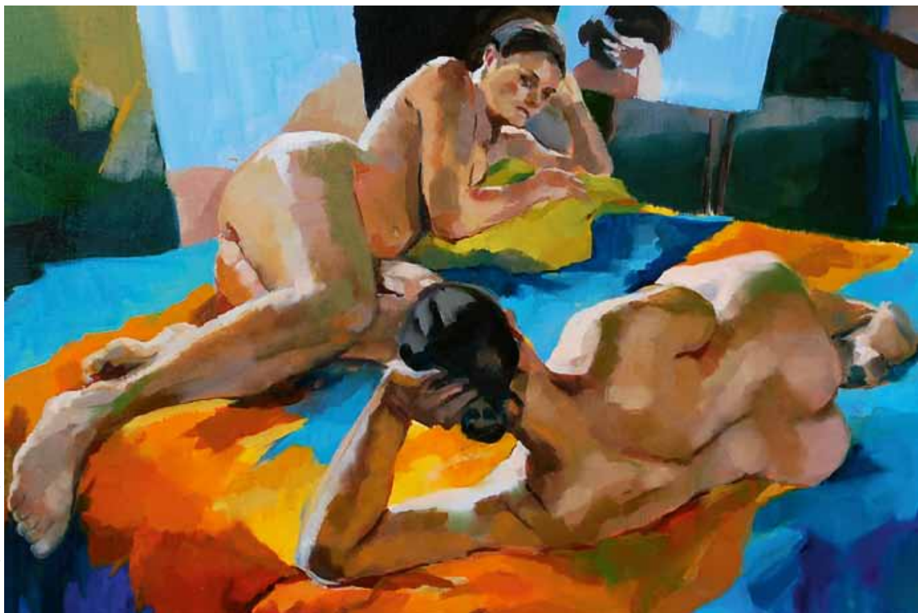
◆ Quand je suis seule, je prends 2 cafés et je m'invite, huile sur toile 100 x 80 cm, 2010.