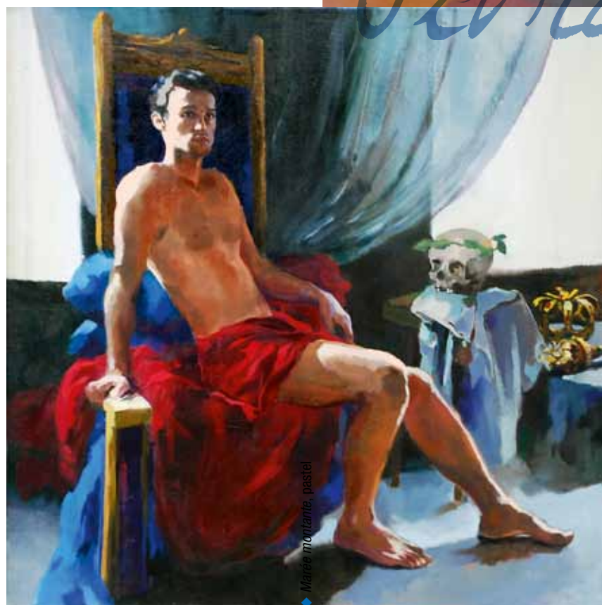
◆ Vanité, huile sur toile 80 x 80 cm, 2010.

Contacts : reportez-vous à notre carnet d'adresses p.52