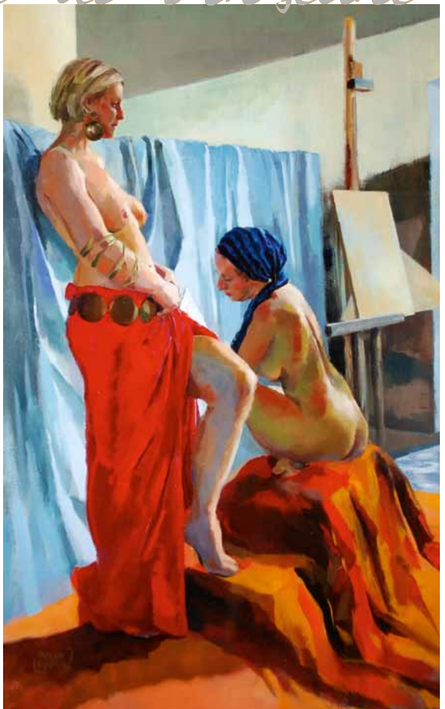
◆ La Lettre, huile sur toile, 116 x 73 cm, 2010.